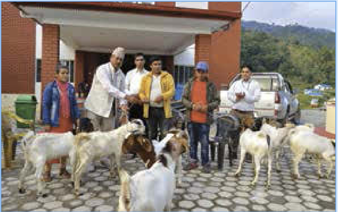
वयर बोका वितरण