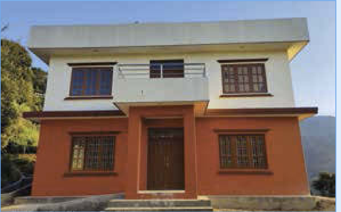
६ नं. वडा कार्यालय भवन