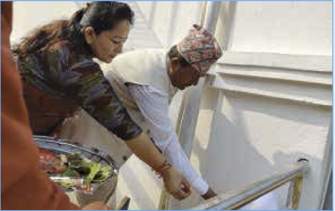
गाउँपालिका भवनको गृह प्रवेशको समयमा अध्यक्षज्यू र उपाध्यक्षज्यू