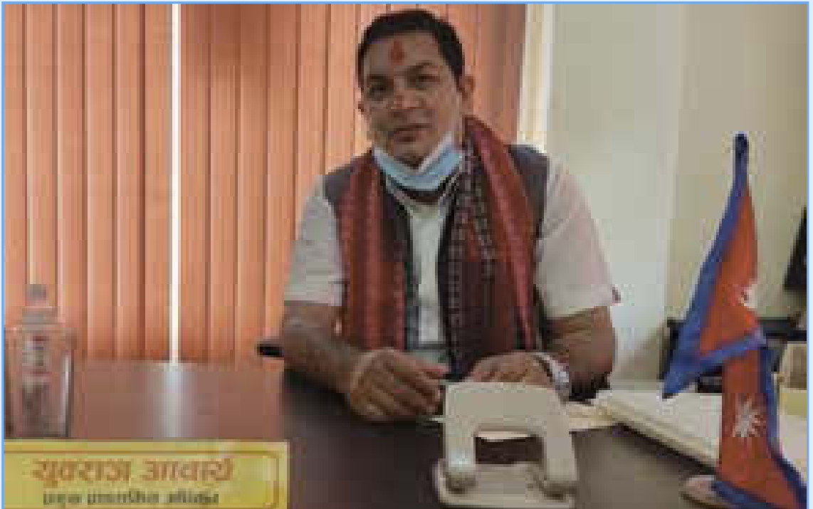
प्रमुख प्रशासकीय अधिकृत युवराज आचार्यको पदबहाली