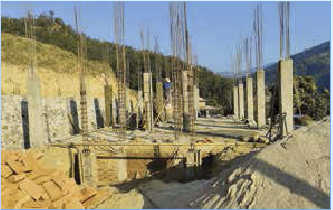
निर्माणाधिन स्वास्थ्य इकाई भवन