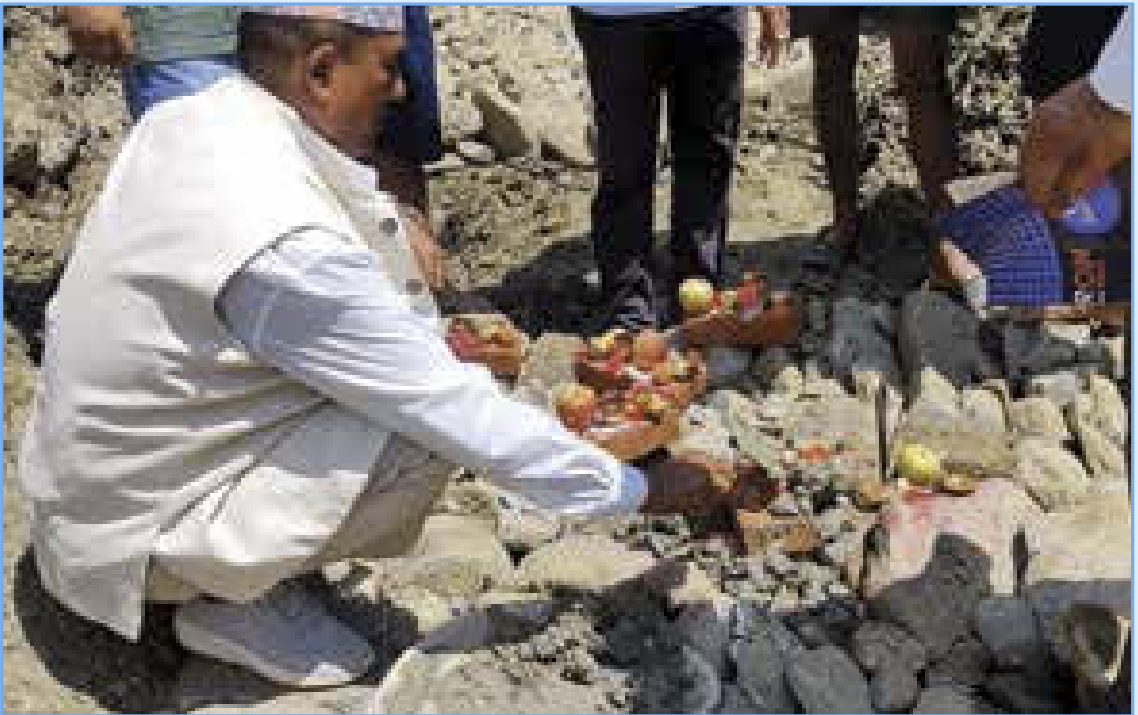
निर्माणाधिन कोल्ड स्टोर