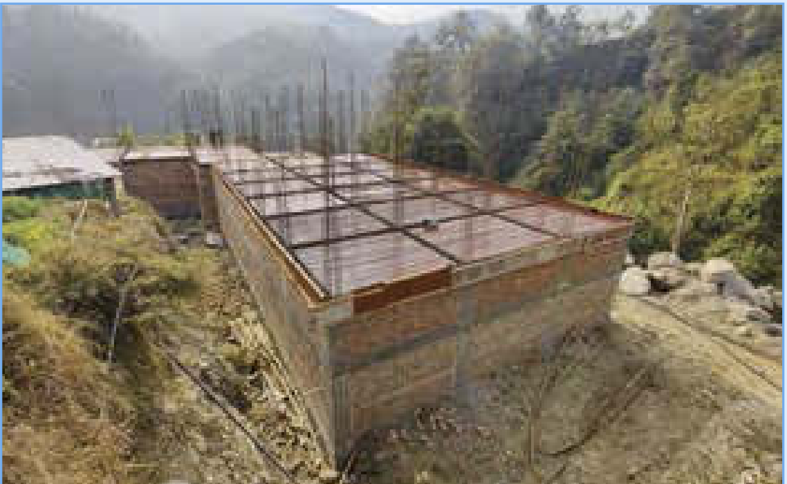
निर्माणाधिन कोल्ड स्टोर