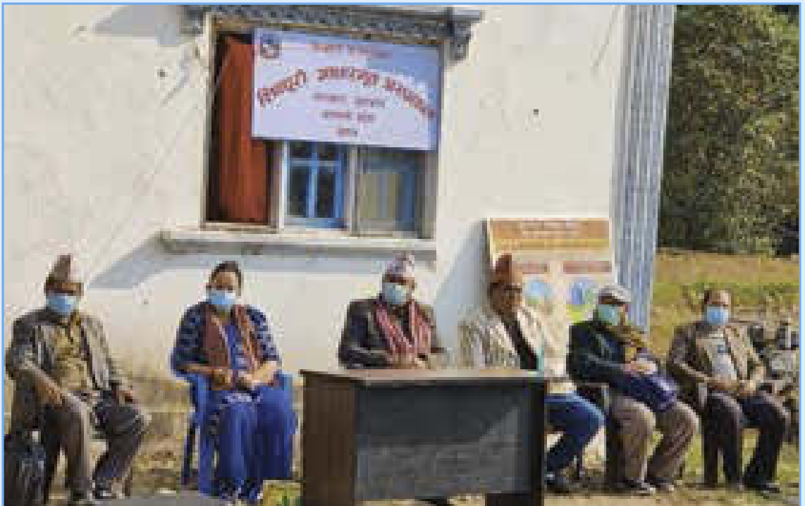
आधारभुत अस्पताल उद्घाटन कार्यक्रम