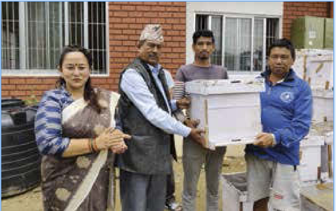
मौरी घर वितरण