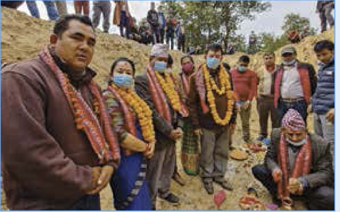
७ नं. वडा कार्यालय भवन सिलन्यास