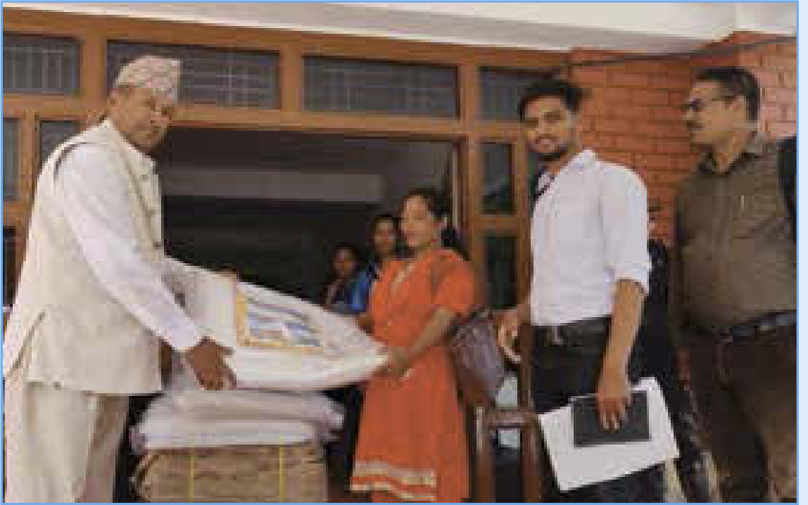
सिलपाउलिन प्लाष्टिक वितरण