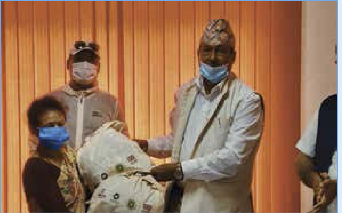
शक्ति समूहबाट सहयोग प्राप्त